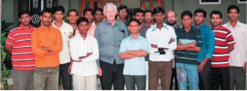
Il Padre Generale in India

4-9 Gennaio: La nuova Provincia Indiana ha tenuto la sua prima Congregazione Provinciale ed i cui decreti sono poi stati approvati dal Padre Generale il 20 marzo 2010.